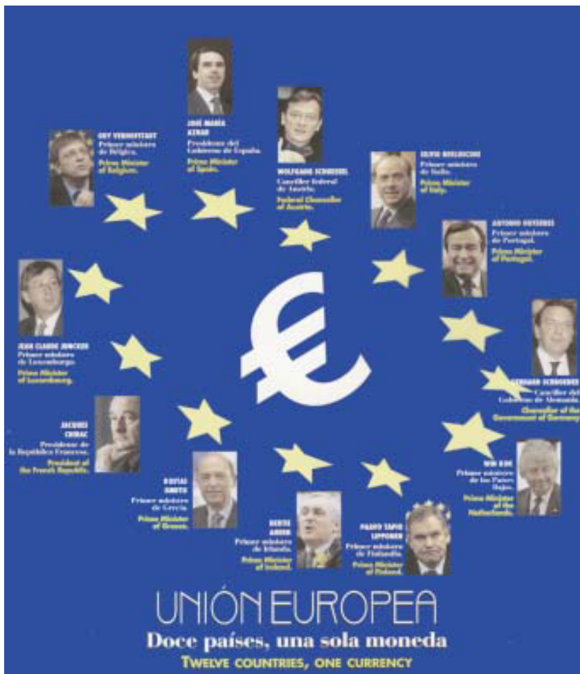
A képen ama tizenkét ország kormányfői láthatók, akikkel 2002. január 1. elkezdődött a valuta-unió.