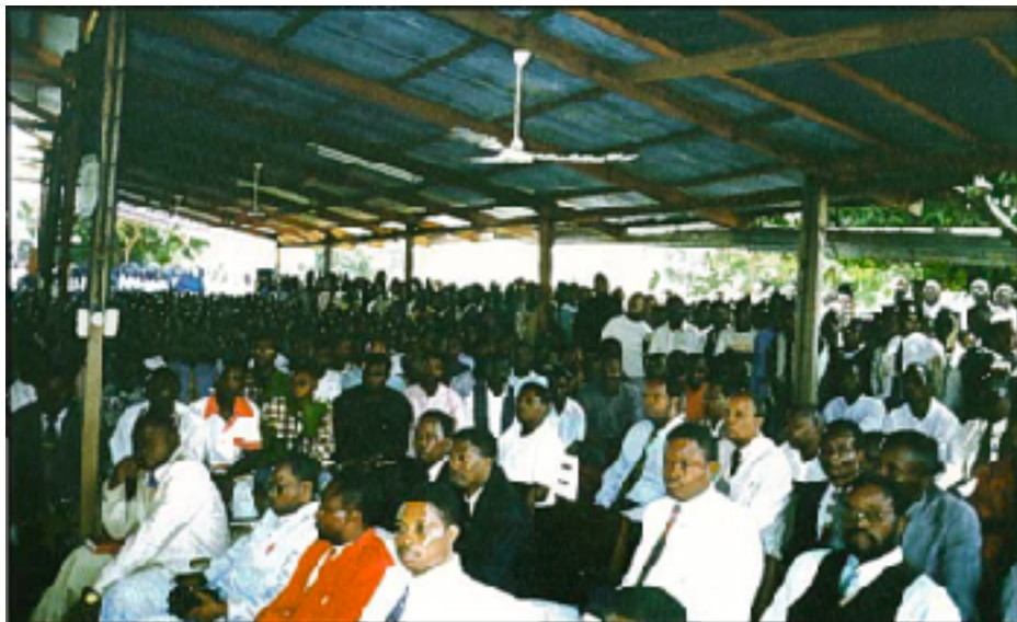
Časť zhromaždení v Zaire v septembri 1996, ktoré dosiahli návštevnosť od troch do desaťtisíc ľudí. Chvála Bohu za veľkú úrodu duší!