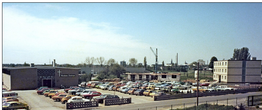
O fotografie a clădirilor misiunii în timpul construcției în 1977/78.