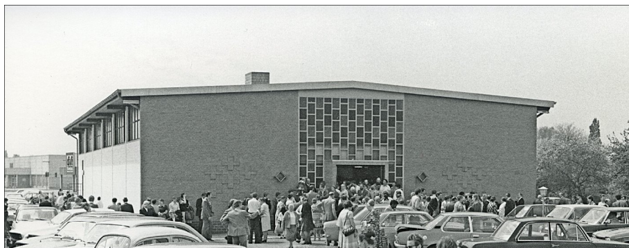
Inaugurarea clădirii bisericii noastre, în 1974