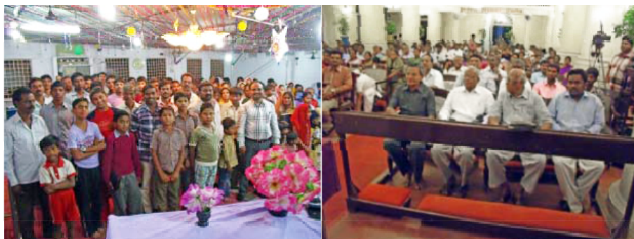
Două fotografii cu frații și surorile noastre din India.

Cu adevărat, toate națiunile și semințiile sunt binecuvântate în Isus Hristos, așa cum a făgăduit Domnul lui Avraam (Gal. 3:14). Noi suntem conștienți că acum are loc ultima chemare astfel ca și ultimul să fie chemat.