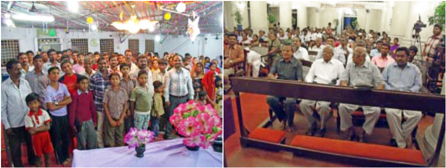
Deux photos avec les frères et soeurs de l'Inde

Si vous êtes intéressés à recevoir nos brochures, vous pouvez nous écrire à l'adresse suivante :