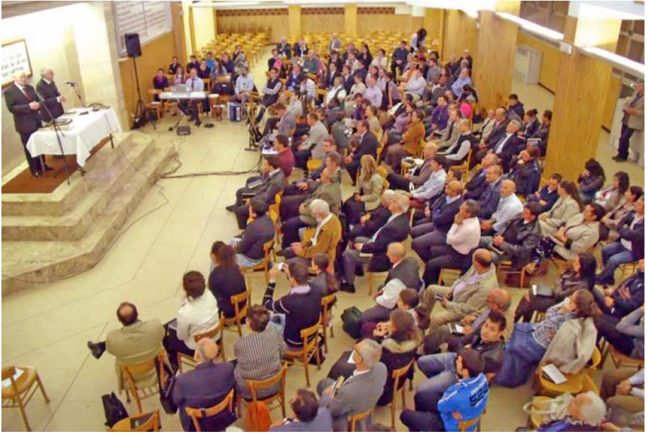
Adunarea din Roma, Italia