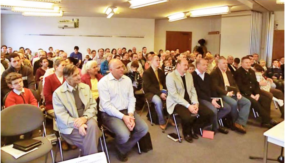
Adunarea din Graz, Austria