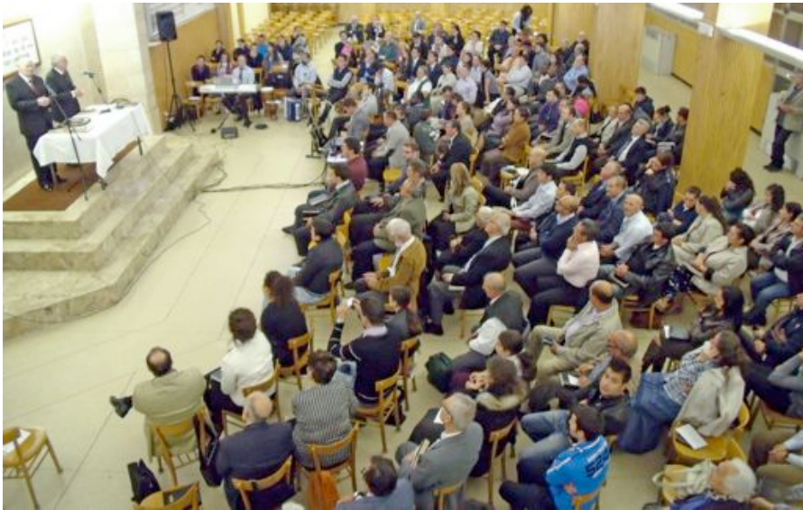
Zhromaždenie v Ríme.