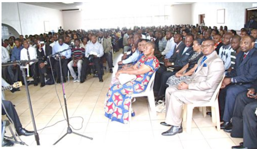
Fotografia ukazuje zhromaždenie v Johanesburgu.