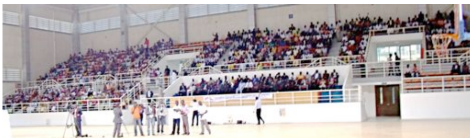
Na fotografii je časť veľkého zhromaždenia na štadióne v Luande v Angole.