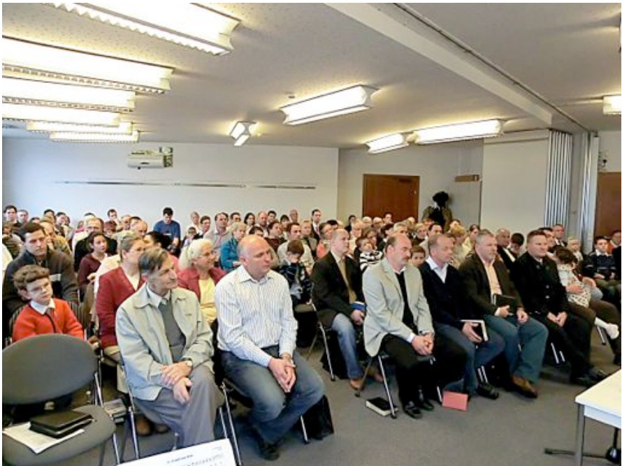
Fotografia zo zhromaždenia v Grazi v Rakúsku.