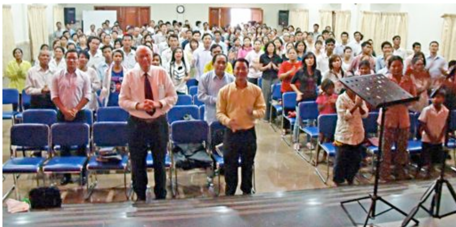
Fotografia zo zhromaždenia v Phnom Penh v Kambodži.