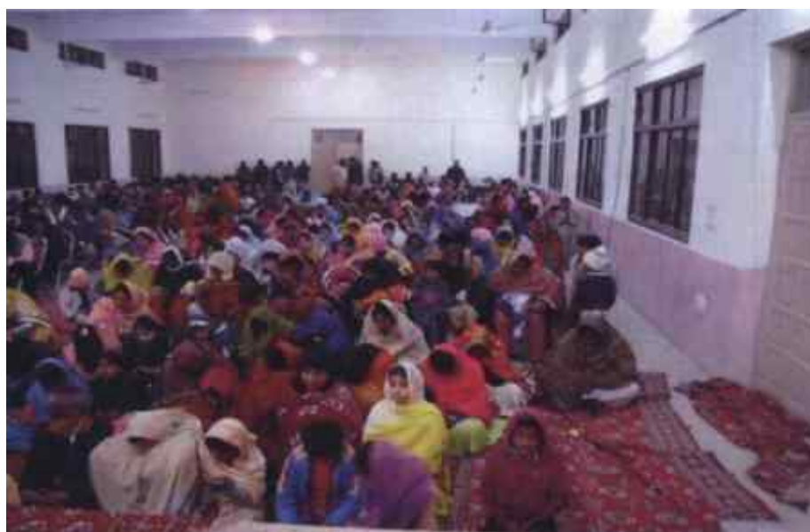
Всички те са в народна носия.