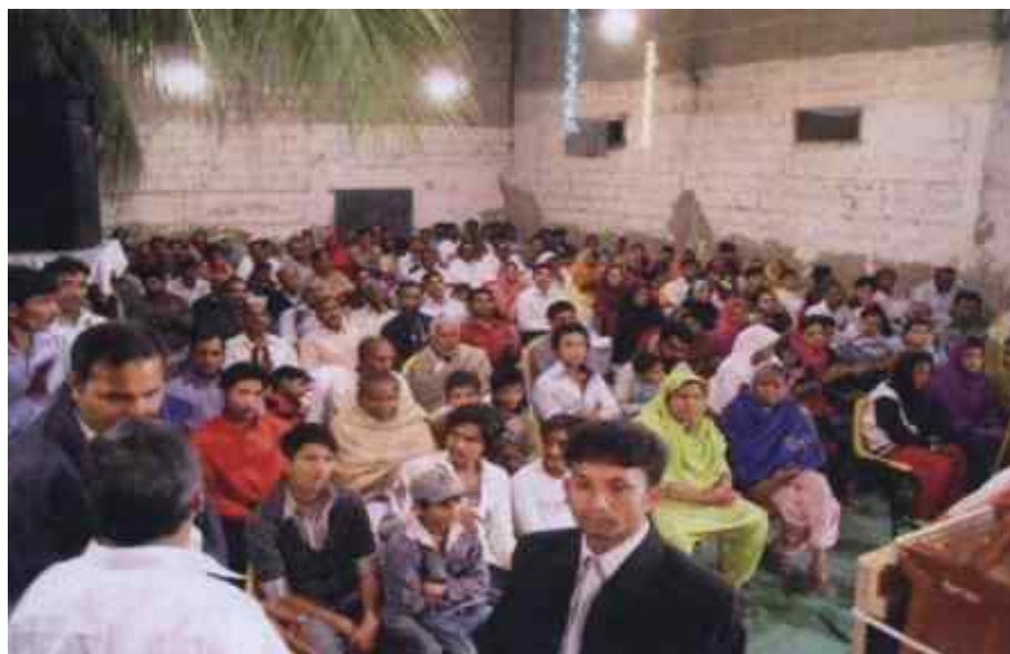
Все още може да наемаме зали.