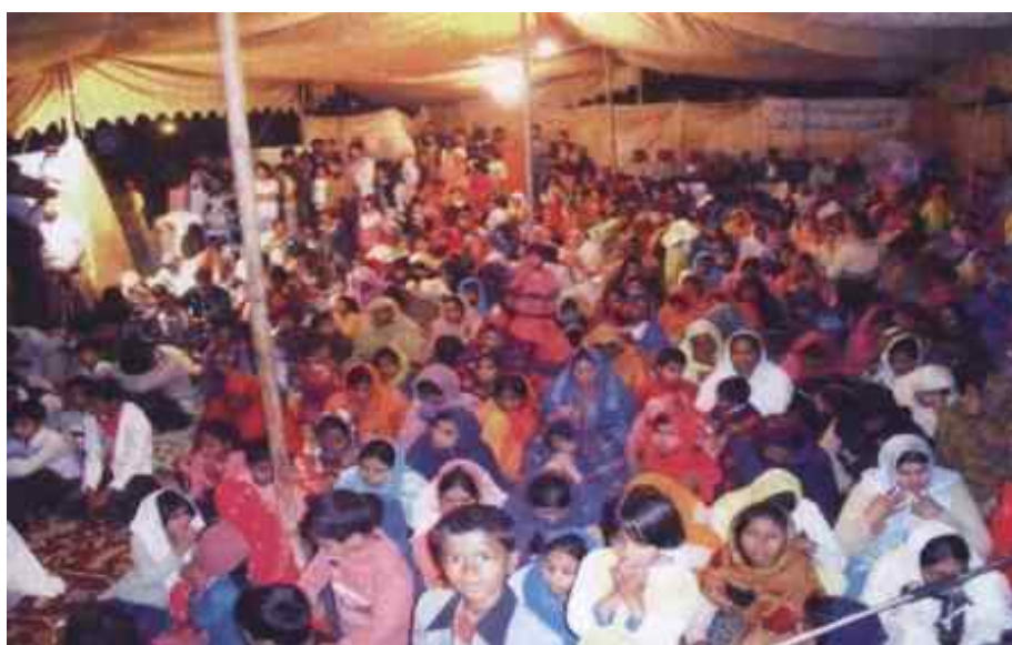
Дори младите хора са били достигнати.