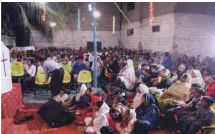
Слушателите слушат внимателно.