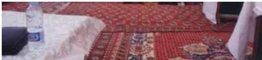
Мъжете и жените седят поотделно.