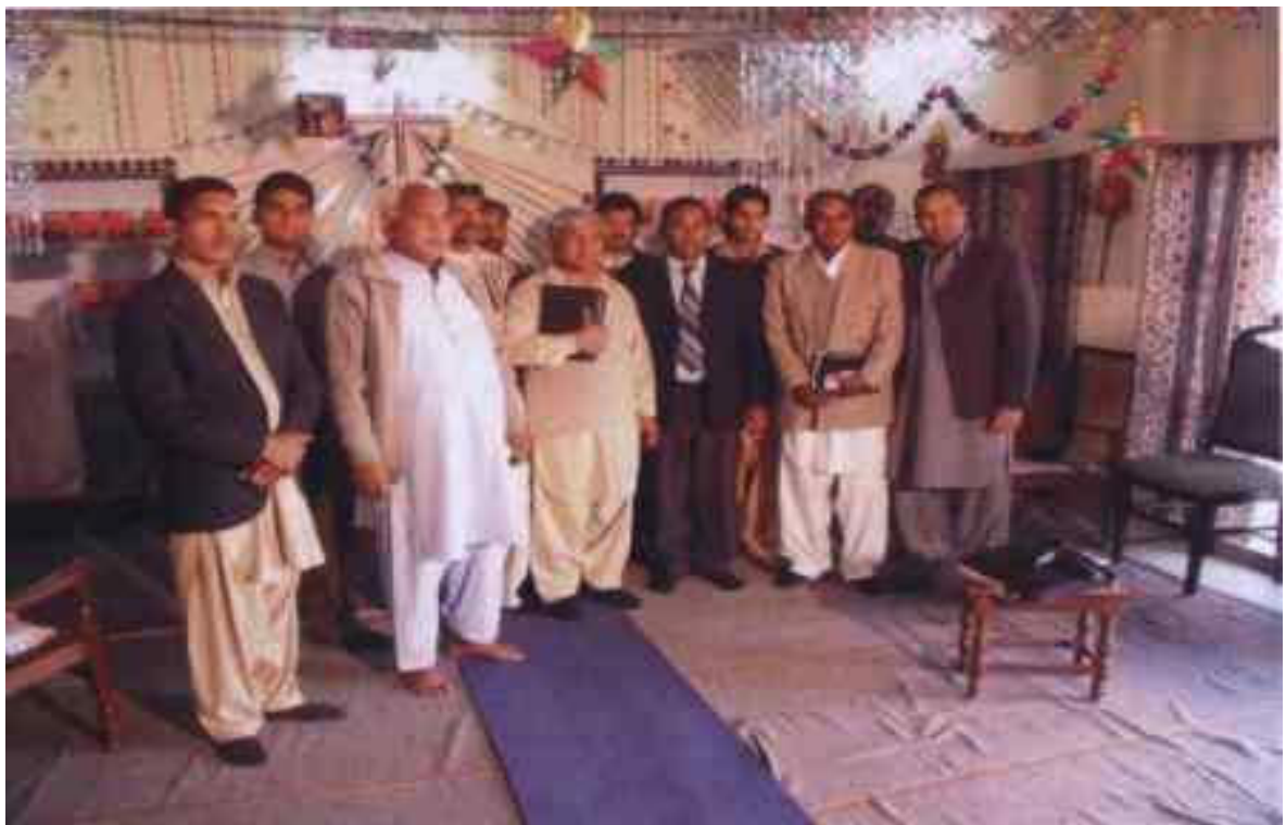
Някои братя служители