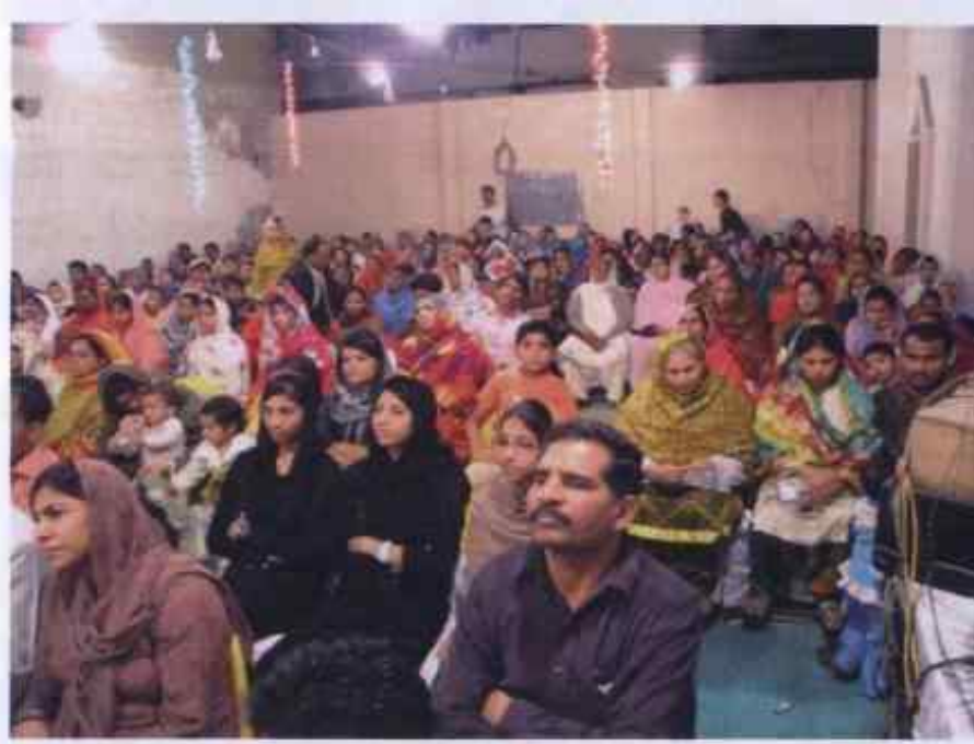
Снимката от Исламабад, Пакистан на 20 февруари, 2010 г.