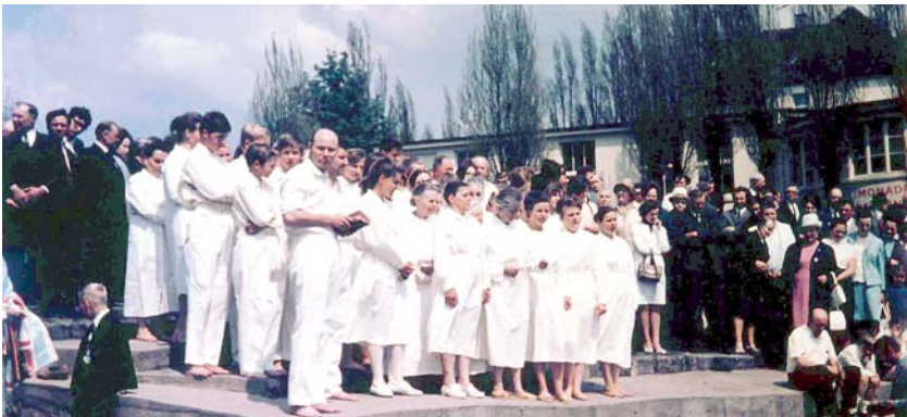
Depuis 1966 des milliers de frères et sœurs ont été baptisés dans le Nom du Seigneur Jésus-Christ