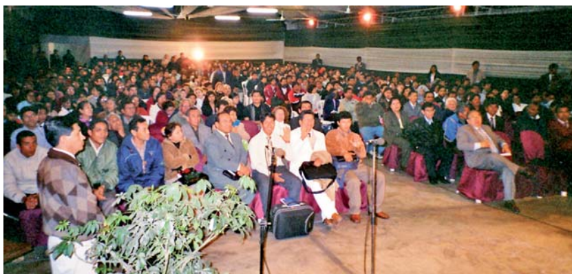
Une réunion à Lima (Pérou) en octobre 2007