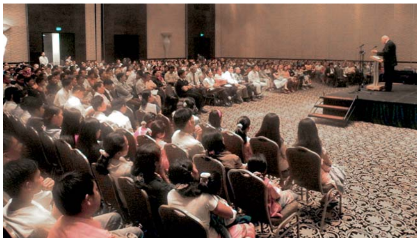
Une réunion à Manille (Philippines) en septembre 2008