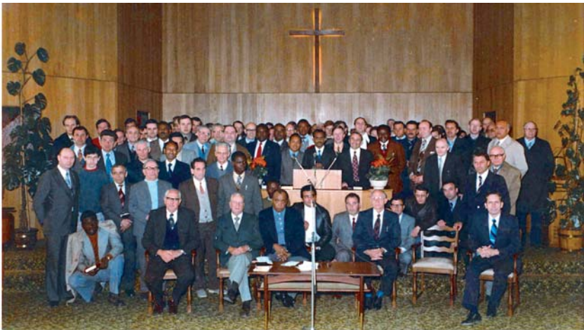
Une photo de la conférence internationale des ministres en avril 1976. Des frères de 33 pays y prirent part.

« L'Esprit et l'Épouse disent: Viens. Et que celui qui entend dise: Viens...Oui, je viens bientôt. Amen! Viens, Seigneur Jésus!