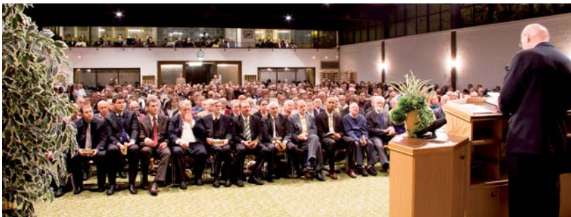
Une réunion au Centre missionnaire de Krefeld en novembre 2008