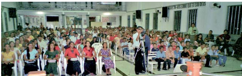
Une réunion à Belém (Brésil) en octobre 2007