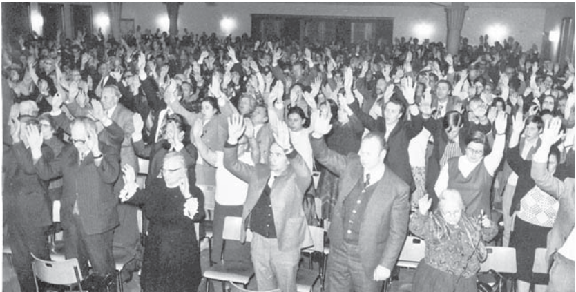
Une réunion à Zürich (Suisse) le dimanche de Pâques en 1975