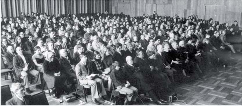
Une réunion à Heilbronn (Allemagne) le samedi de Pâques en 1975.