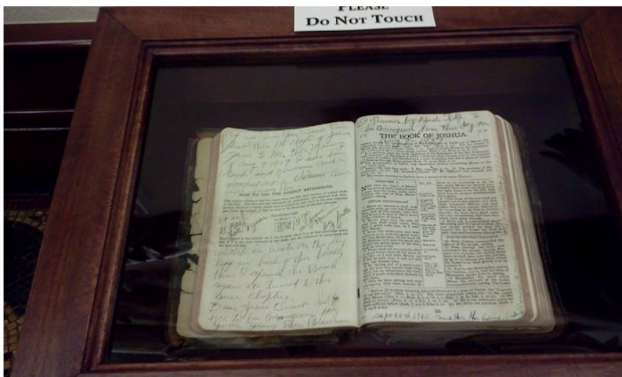
La Bibbia di casa del fratello Branham come l'ha lasciata nel dicembre 1965.