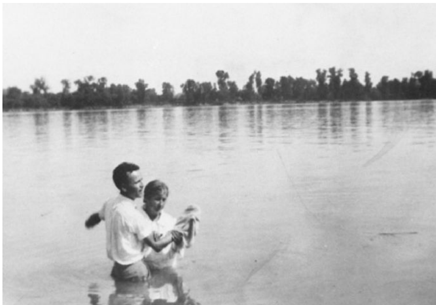
Il primo battesimo fatto dal fratello Branham l'11 giugno 1933 nel fiume Ohio.